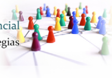
TABLA DE LAS COLABORACIONES